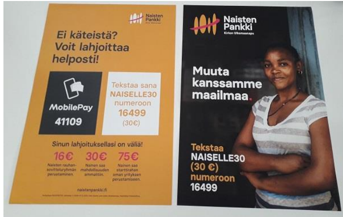
Naisten Pankin lahjoitusjulisteet A3 kaksi erilaista