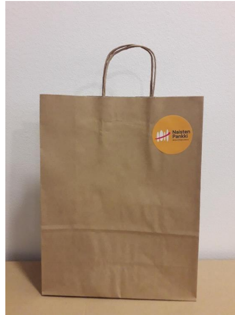
Ruskea paperikassi (25 x 11 x 32 cm 110g, punoskannike) + NP tarra (tarra liimattava kassiin erikseen)