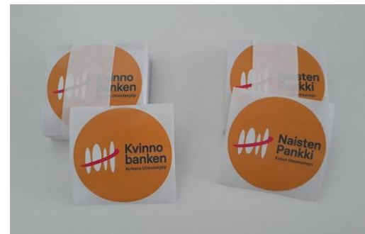
Naisten Pankin tarra, saatavilla suomi, ruotsi ja englanti. Tilattavissa oleva määrä 100 kpl /pkt